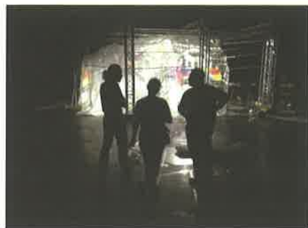
L'installation de la grotte Chauvet pour Experimenta

Conjard, conscient d'être un des rares à afficher des soutiens à la hausse. « C'est le paradoxe. Tout le monde préfère financer des projets et, pourtant, il faut du temps pour tisser des réseaux. » C'est bien l'expérience acquise qui permet à la Biennale de mettre des partenaires du territoire en résonance au-delà d'une logique de promotion ou de marketing territorial. Au plan national, l'Hexagone vise au titre de centre national arts et sciences, objectif affiché par la convention 2014-2016 signée avec les tutelles locales et les ministères de la Culture, de la Recherche et de l'Économie. Le projet est d'être identifié comme structure de référence et de stimuler les échanges entre les scènes, de plus en plus nombreuses, engagées dans cette voie, comme le Phénix de Valenciennes, l'Athanon à Saint-Nazaire et Nantes, le Citron jaune à Port